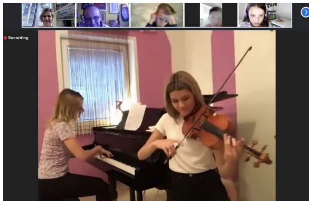
Duo Krstić, klavir i violina

https://www.zmajevci.com/nastava-na-daljinu